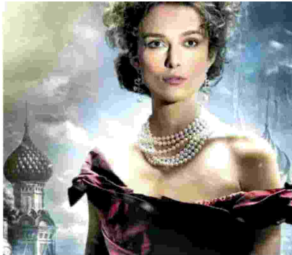
▲ Anna Karenina interpretata da Keira Knightley